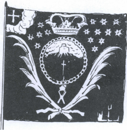
Svart kompanifana. Preobraschenska gardet.

gardesfanorna för 1706 i själfva verket härstamma från 1699; att dessa fanor till följd af gardenas tappra stöd vid Narva blefvo ytterligare prydda, hvarigenom 1701 års typ uppkom, samt att den för Preobraschenska gardet för 1700 från ryskt officiellt håll anförda typen blott är fanorna för ett af nämnda regementets kompanier, nämligen tsarens eget eller det s. k. bombarderkompaniet. Då detta kompani följde tsarens person är det ju ej underligt att dess fana undgått nederlaget vid Narva. Att den i Stockholm tryckta svenska förteckningen iakttager tystnad, beror därpå att gardesfanorna kommit till Stockholm utan stänger och därför blifvit inräknade bland de lösa fanor, som blott angifvas till antal utan att beskrifvas.